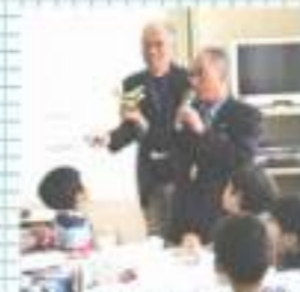
※昨年度受講者アンケートより