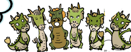
みたかボランティアセンター 職員一同